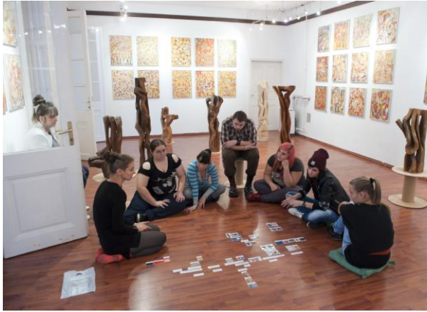
Kalmári stílusjegyek (absztrakt játékok)