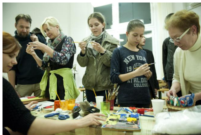
Retró '80 (kitűző készítése, 2014.november 7.)