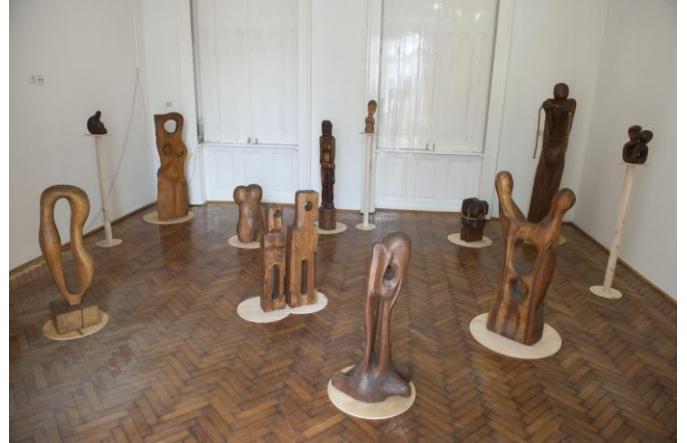
Rudnay Gyula tanítványainak pedagógiája