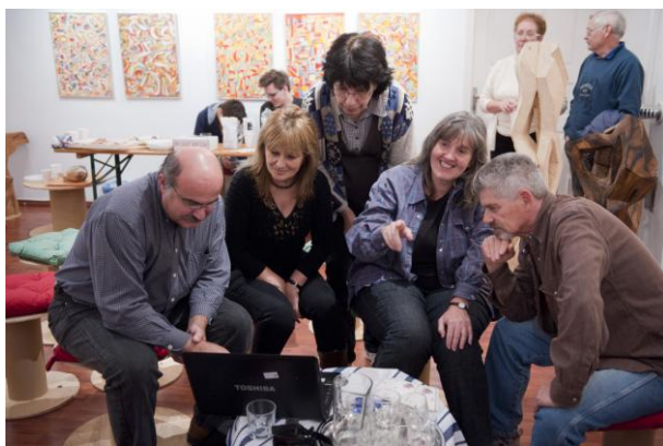
Retró '80 (régí képek, 2014.november 7.)