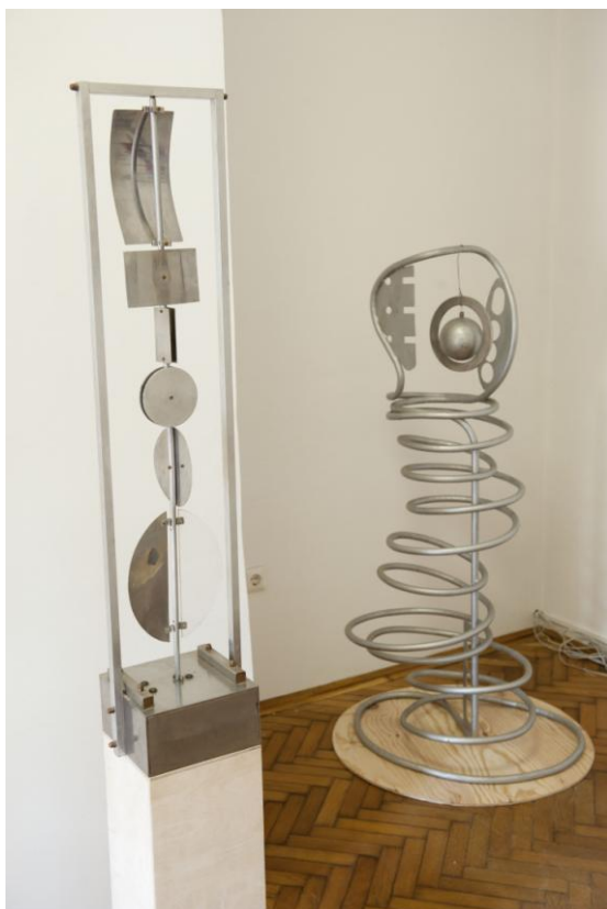
„Nicolas Schöffer hazajön...”