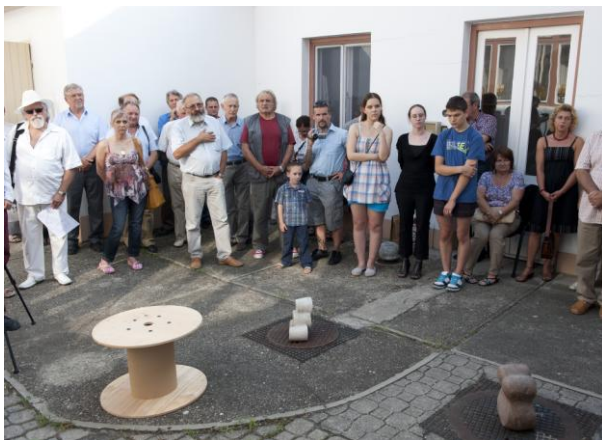
Kalmár Pál életmű-kiállításának megnyitója