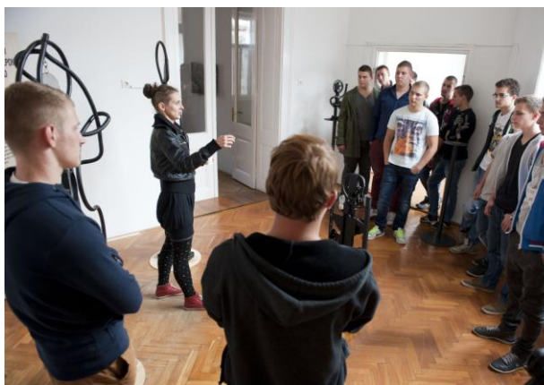
„Nicolas Schöffer hazajön...” (Kinetika vagy mobil)