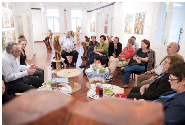
MűvHázak az 1970/80-as években (2014.október1.)