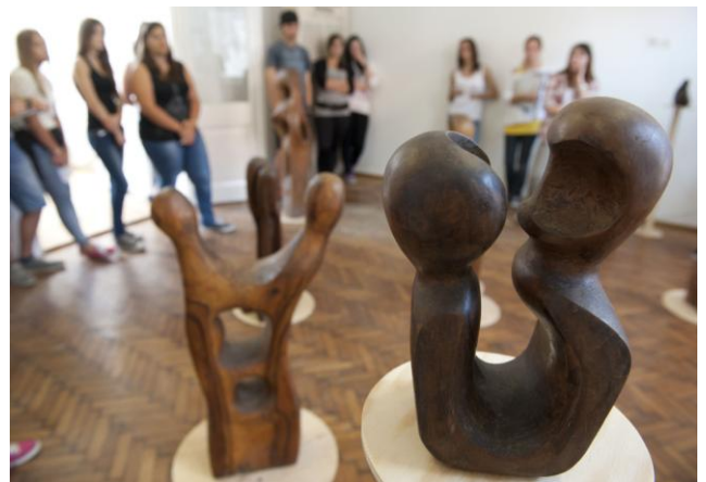
Rudnay tanítványok pedagógiája (1970-es évek vs. ma)