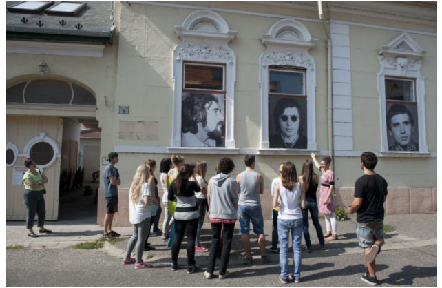
Portrék cenzúra nélkül (1970/80-as évek vs.ma)