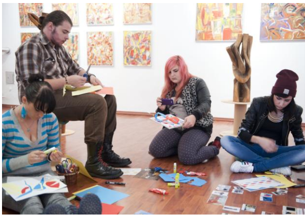
Kalmári stílusjegyek (absztrakt játékok)